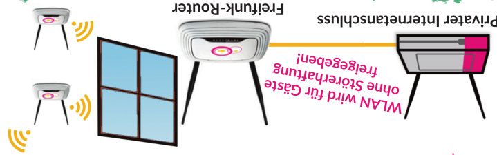
Faltblatt 25.9.2015